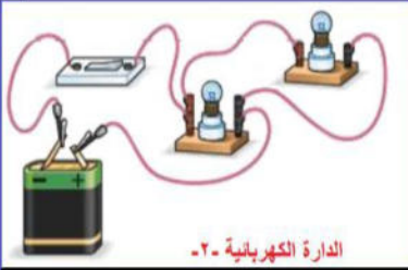
الدارة الكهربائية -2-