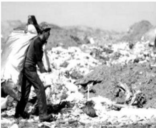
مكان إفراغ النفايات (مزبلة)