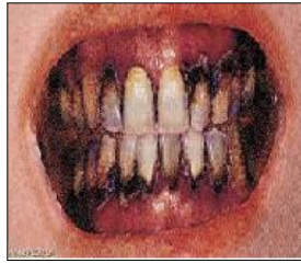
الوثيقة 2: أسنان شخص مدمن