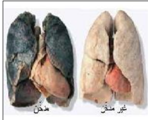
الوثيقة 3: رئة سليمة و رئة مصابة

بينما كنت تشاهد التلفاز مع أختك الصغرى شاهدتم حصة أضرار التدخين على صحة الإنسان، حيث يمثل يوم 31 ماي اليوم العالمي بدون تدخين. التدخين يؤثر سلبا على صحة الإنسان حيث يؤدي إلى هزال الجسم و اصفرار الأسنان و الروائح الكريهة.