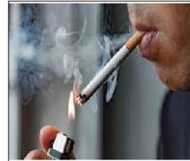
الوثيقة 1: شخص مدمن