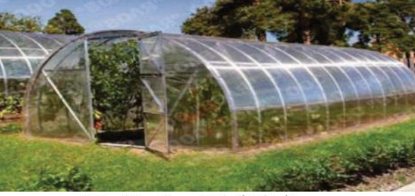
الوثيقة (1) بيت بلاستيكي

الوضعية الأولى (06 نقاط) : في إطار الدعم الفلاحي ، تحصل عمي صالح على 5 بيوت بلاستيكية لتطوير الانتاج الفلاحي في المناطق الريفية . حيث تعتبر البيوت البلاستيكية فتحا جديدا في عالم الزراعة لأنها توفر للنبات الظروف المناسبة لنموه . كما توضح الوثيقة (1)