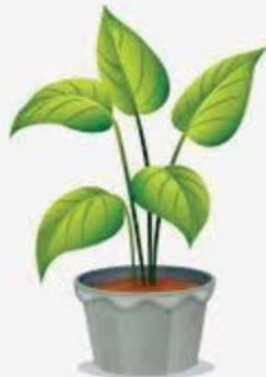
السند (1) : النبات الأخضر

ملاحظة : نبات اللعاعة ( ENDIVE ) نوع من الخس قليل اليخضور .