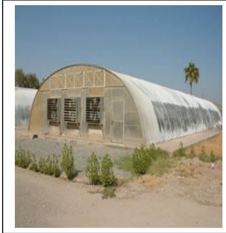
الوثيقة - 2 -