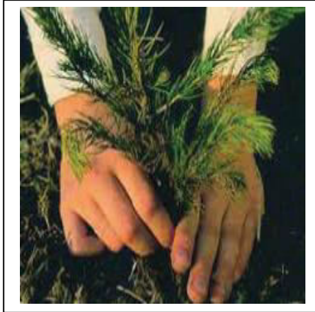
الوثيقة - 3 -