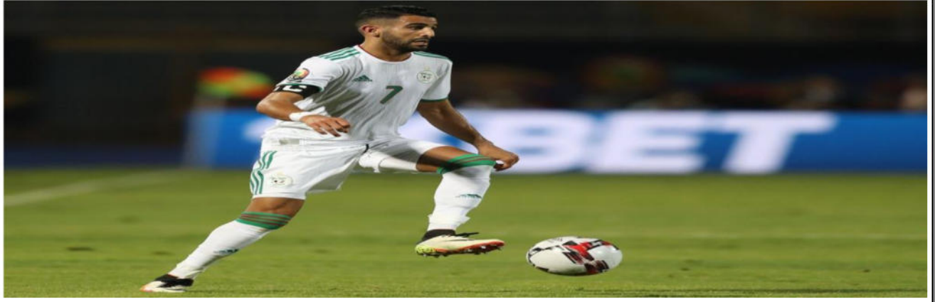
الوثيقة - 1 -

رياض محرز لاعب موهوب و فنان صانع أفرح المنتخب الجزائري و نادي مانشستر سيتي، للحفاظ على لياقته البدنية يتناول راتب غذائي يدعي راتب العمل ( النشاط ).