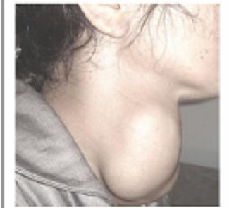
صورة جانبية لامرأة مصابة بالمرض