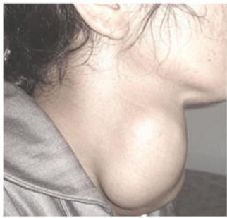
الوثيقة 3 : صورة جانبية لامرأة مصابة بالمرض

السماك مصدر طبيعي للبروتين غني بعنصر اليود ، عنصر الكالسيوم ، عنصر الفوسفور