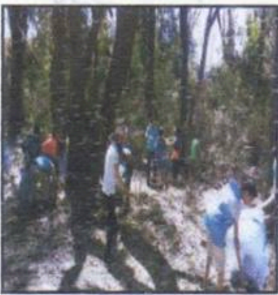
المحافظة على البيئة