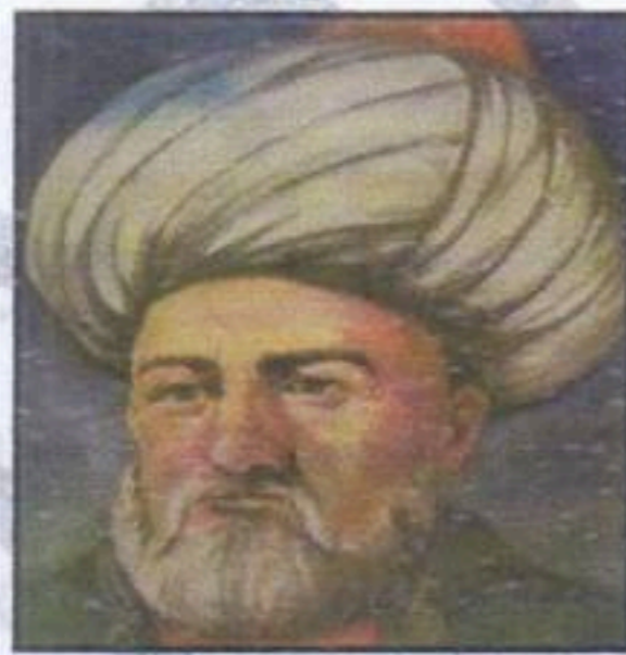
خير الدين برباروس