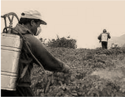
الوثيقة - 1 -

يَسْتَعْمِلُ المُزَارِعُونَ بعض المحاليل الشارديّة لمُعَالَجَةِ النَبَاتَاتِ من بعض الأمراض. من بين هذه المحاليل نذكر: محلول كبريتات النحاس (Cu^{2+} + SO_4^{2-}) ذي اللون الأزرق. و بغرض رَشِّ هذا المحلول على النَبَاتَاتِ، قام مُزَارِعٌ بوضع هذا المحلول في دَلْوٍ مَطْلِيٍّ بطبقة من معدن الزنك (Zn) ( الوثيقة - 1 - ). بعد مُدَّةٍ زمنية، تَفَاجَأَ المُزَارِعُ بزوال اللون الأزرق للمحلول، ويتشكّل طبقة حمراء على الجدار الداخلي للدلو، ويظهر محلول جديد عديم اللون.