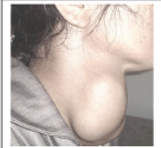
صورة جانبية لامرأة مصابة بالمرض