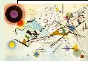
02: لوحة نجردييه هندسيه بمختلف الخطوط للفنان فاسلي كندنسكي