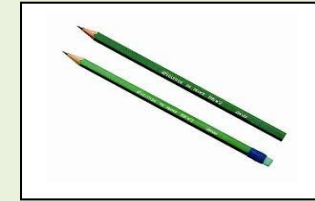
04: اقلام الرصاص