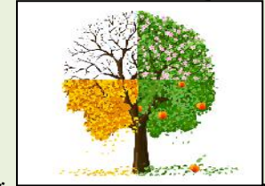
رقم 01: شجرة الفصول الاربعة