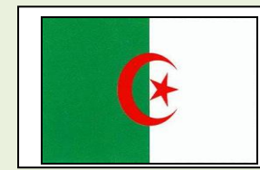
02: العلم الوطني