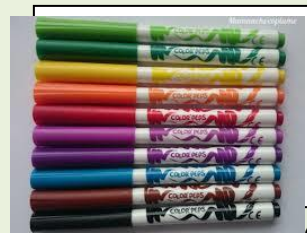
06: ادرم المسويه