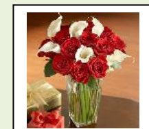
نموذج رقم 01: مزهريّة