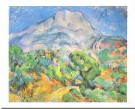
لوحة لبول سيزان — جبل سانت فيكتور